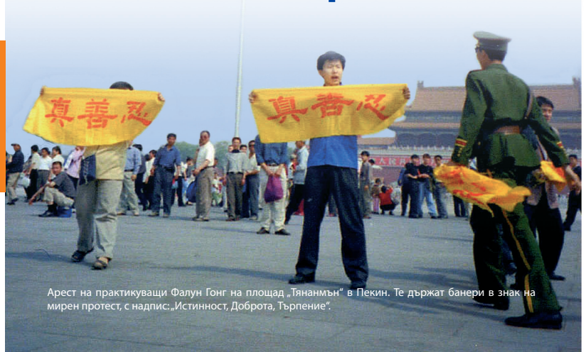
Арест на практикуващи Фалун Гонг на площад „Тянанмън“ в Пекин. Те държат банери в знак на мирен протест, с надпис: „Истинност, Доброта, Търпение“.