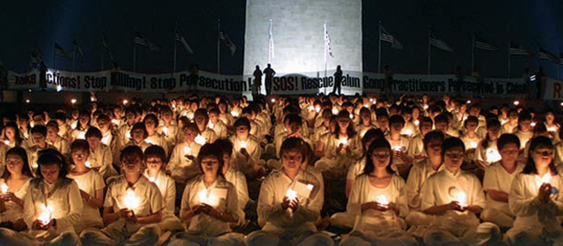
Мирно бдение в памет на убитите от началото на преследването (20 юли 1999 г.)